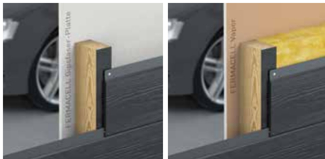
Skladba bez izolace